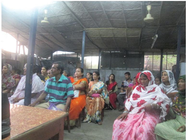
Eltern von behinderten Kindern an der Informationsveranstaltung.

Am 17. September 2016 organisierte Calcutta Rescue eine Informationsveranstaltung für die Eltern der behinderten Kinder, welche im Behindertenprogramm betreut werden. Zwei Sonderpädagogen des nationalen Instituts für geistig Behinderte (National Institute for the Mentally Handicapped, NIMH) informierten über die Rechte von behinderten Menschen sowie die Unterstützung, welche der Staat bietet, und zeigten auf, wie die soziale Akzeptanz von Behinderten verbessert werden kann. Ferner wiesen sie darauf hin, dass Behinderte Anrecht auf kostenlose Bildung, Gesundheitsversorgung und Transport haben, und erläuterten auch die verschiedenen Versicherungsmöglichkeiten für Behinderte. Rechtliche Basis für diese Aspekte bildet das Gesetz über Menschen mit einer Behinderung (Persons with Disability Act), welches vorgestellt wurde. Es war ein sehr informativer Anlass, der von rund 40 Personen besucht wurde. ■