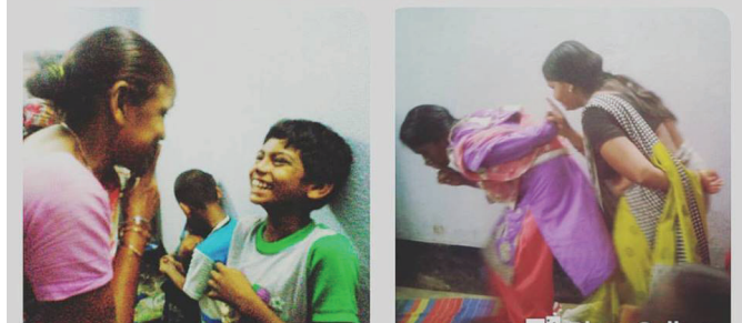
Mitglieder von Urotaar in Aktion mit den Kindern im Theaterkurs.