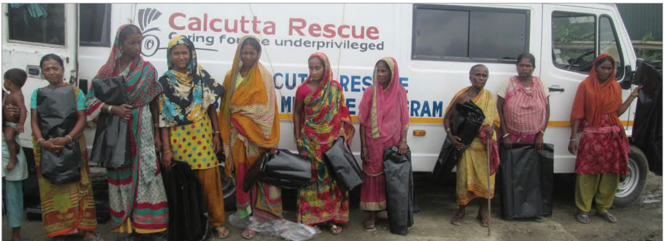
Schutz vor Sturm - Gratis Blachen-Verteilung im Rahmen des Strassenmedizin-Programms.