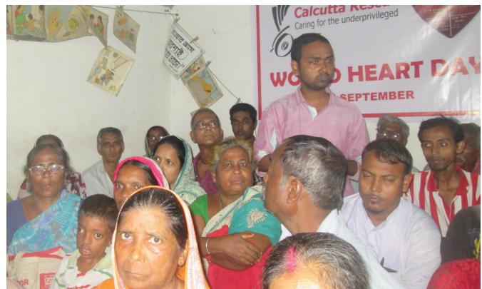
Ein Patient der Talapark-Klinik erläutert den anderen Teilnehmenden seine Ernährungsweise.

Thematisiert wurden insbesondere die verschiedenen Risikofaktoren für Herz-Kreislauf-Erkrankungen und die Wichtigkeit von körperlicher Betätigung und gesunder Ernährung zur Verhinderung von Krankheiten wie Schlaganfall und Herzinfarkt. ■