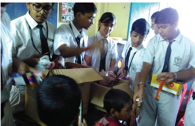
Besuch der Delhi Public School.

Raksha Bandhan ist ein hinduistisches Fest, an dem die Verbundenheit und Verpflichtungen zwischen Geschwistern, aber auch zwischen Freunden gefeiert werden. Im Rahmen dieses Festes besuchten am 17. August 2016 Schülerinnen und Schüler sowie Lehrkräfte der Delhi Public School die Talapark-Schule von Calcutta Rescue und brachten Geschenke mit. Alle hatten grossen Spass zusammen. ■