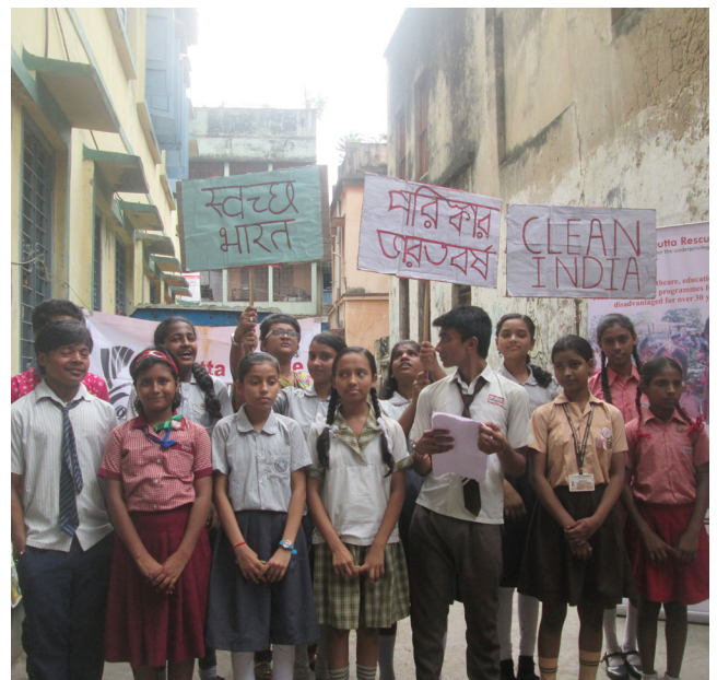
Die Schulkinder möchten das Interesse für die Kampagne „Swachh Bharat Avijaan“ wecken.

„Swachh Bharat Avijaan“ ist eine Kampagne der indischen Regierung zum Thema Sauberkeit und wurde auf Initiative von Premierminister Narendra Modi lanciert. Sie soll mithelfen, die Vision eines sauberen Indiens zu verwirklichen. Inspiriert von der Kampagne wurden die Schulkinder der Schule Nr. 10 von Calcutta Rescue, welche mehrheitlich aus Slums und sozial benachteiligten Familien stammen, selber aktiv und führten ein Theaterstück zum Thema Sauberkeit auf. Sie wurden dabei von der Nichtregierungsorganisation Urotaar begleitet, welche mit Strassentheater arbeitet. Bezirksrätin Sunanda Shaw war bei der Aufführung anwesend und sagte: „Sauberkeit und sanitäre Einrichtungen sind wesentliche Elemente für die Gesundheit und ein friedliches Leben“. Das Hauptziel der Kampagne und der Theateraufführung ist es aufzuzeigen, mit welchen Massnahmen punkto Sauberkeit die Lebensumstände in Indien verbessert werden können. ■