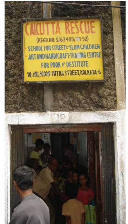
School Nr. 10.

Auch für den Geographieunterricht wurden Methoden besprochen: Zum Beispiel das Beobachten der Auswirkungen der Jahreszeiten oder das Aufzeichnen von Temperatur, Niederschlägen und Sonnenauf- und Sonnenuntergangszeiten anhand der Angaben in der Tageszeitung und die graphische Darstellung der Daten. Die Lehrerinnen und Lehrer von Calcutta Rescue waren sehr erfreut über die vielen neuen Hilfestellungen für den Unterricht. ■