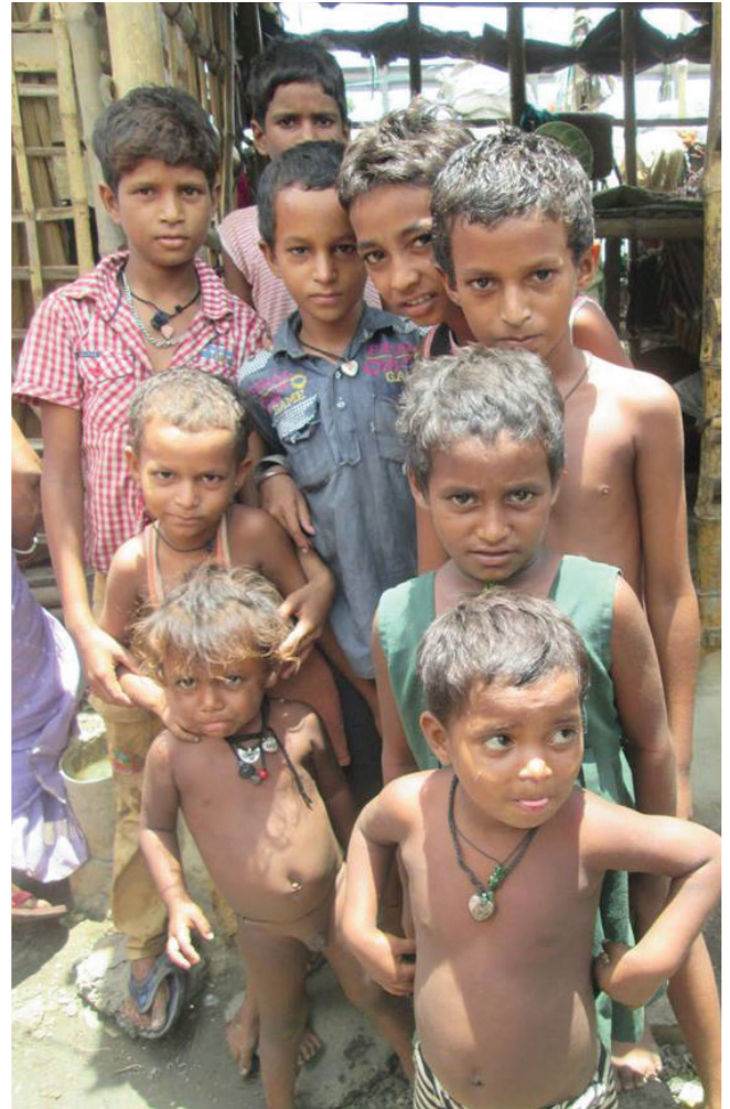
Kinder im Slum von Dakhineshwar.

Das Strassenmedizin-Programm von Calcutta Rescue ist seit August dieses Jahres in Dakhineshwar tätig, einem Slumgebiet von Kolkata, in welchem viele Familien unter sehr unhygienischen Bedingungen in äusserst dürftigen Behausungen leben. Bei einer Untersuchung stellte das Team fest, dass die meisten Kinder unvollständig oder gar nicht geimpft sind. Calcutta Rescue beschloss deshalb, eine Impfaktion durchzuführen. Eine erste Gruppe der 300 Kinder wurde Ende September in die Talapark-Klinik gebracht, wo sie die ersten Impfdosen erhielten. Die Eltern wurden instruiert und gebeten, mit ihren Kindern einen Monat später für die Folgeinjektionen in die Klinik zu kommen. ■