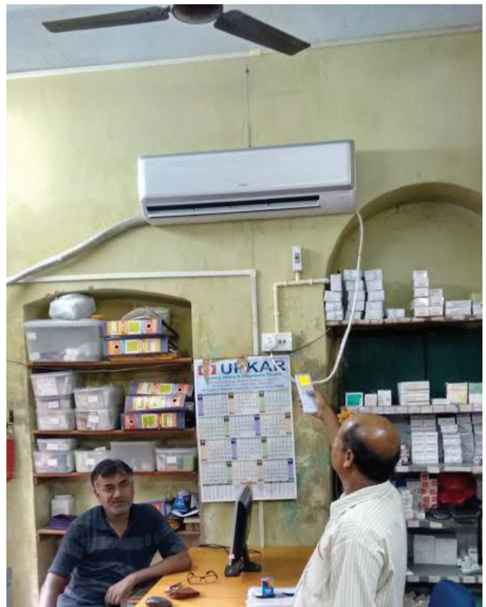
Die installierte Klimaanlage.

In Kolkata liegt die Tageshöchsttemperatur das ganze Jahr über 25°C- teilweise sehr deutlich darüber - und von März bis Oktober liegt sogar die Tagestiefsttemperatur über diesem Wert. Die Jahresdurchschnittstemperatur liegt bei 24.8°C. Dazu kommt eine sehr hohe Luftfeuchtigkeit. Ohne Klimaanlage ist es in Kolkata unmöglich, Medikamente korrekt zu lagern. Mit Spenden aus Deutschland und Irland konnte eine neue Klimaanlage für die Apotheke von Calcutta Rescue angeschafft werden. ■